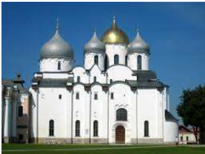
Софийский собор , XI век, Ярослав Мудрый Крестово-купольный храм