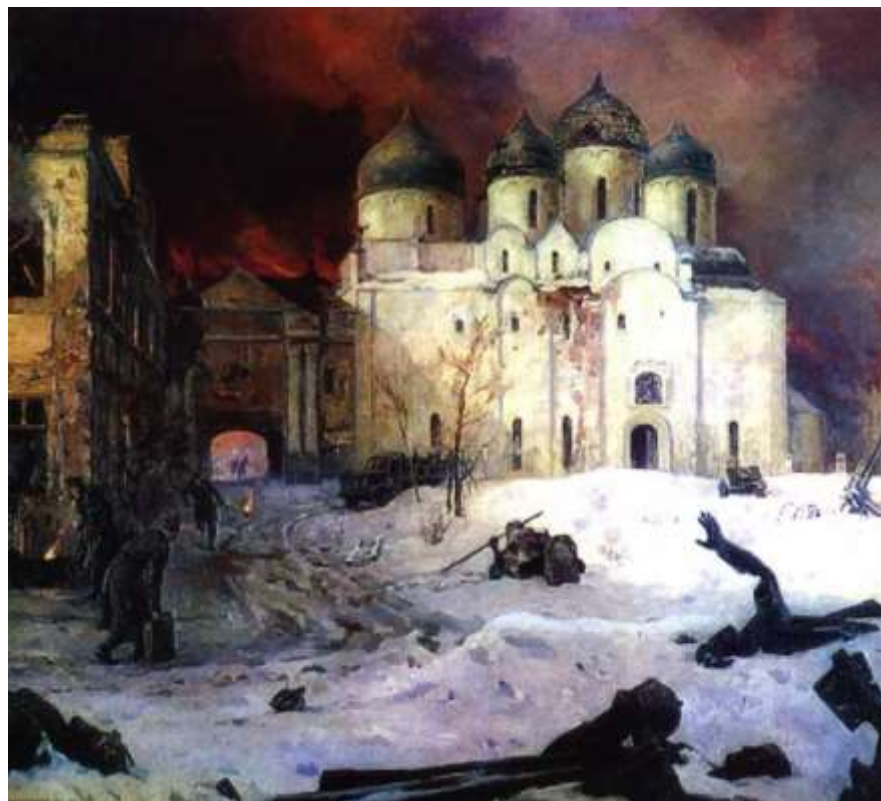
Кукрыниксы Бегство фашистов из Новгорода 1944-1946