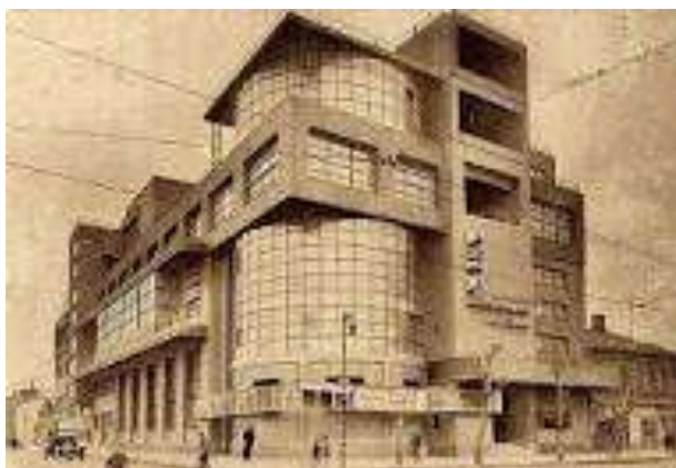
Дом культуры им.Зуева Илья Голосов , Москва 20гг XX века

Обратите внимание на характерные черты важнейших стилей: шатровый стиль, "дивное узорочье", нарышкинское, петровское и елизаветинское барокко, классицизм, ампир, русско-византийский стиль, неорусский стиль, модерн, конструктивизм, сталинский ампир.