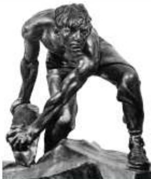
Булыжник – оружие пролетариата. Шадр