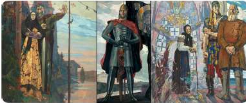
Александр Невский. Корин. 1942-1943

Для выполнения 16 задания прежде всего необходимо хорошо запомнить изображения важнейших памятников культуры. Создайте свою или воспользуйтесь готовыми коллекциями изображений и регулярно ее повторяйте.