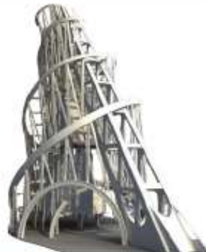
Проект памятника Третьему Интернационалу. Татлин. 1919