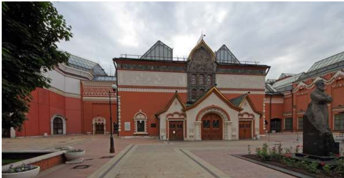
Третьяковская галерея Архитектор А.Каминский , 2 половина XIX века