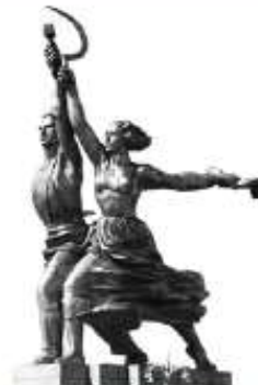
Рабочий и колхозница. Мухина. 1937 Символ Мосфильма